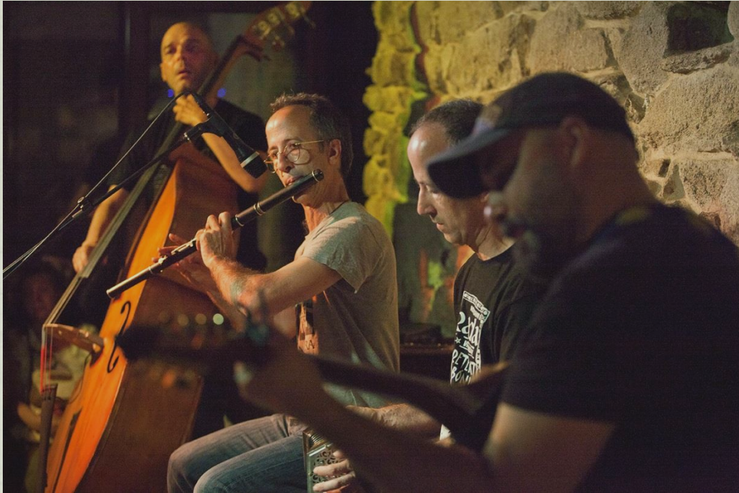
TOR na Arca da Noe de Vilar de Santos, xullo 2020. Rede Galega de Música ao Vivo AGADIC