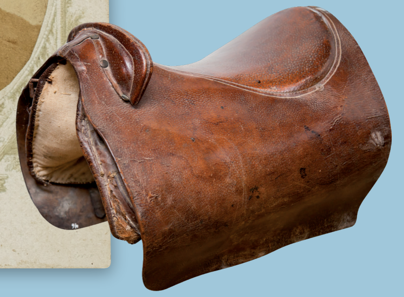
Rodríguez y Romay Fotografos Lugo, 1876